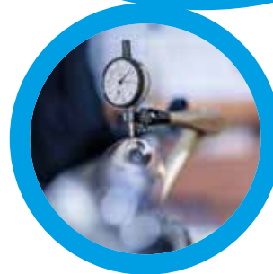
Komponentenfertigung und Zeichnungsteile