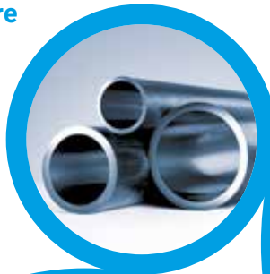
Nahtlose und geschweißte Zylinderrohre